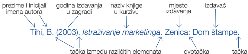
Slika 3. Navođenje knjiga u Literaturi

Osnovno pravilo za navođenje knjiga u Literaturi je dato u prikazu u nastavku.