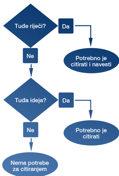
Slika 2. Citiranje tuđih riječi i ideja