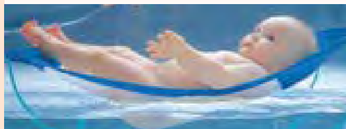
Љубазношћу: „Беба и дјеца“

засновано на њиховом регистрованом индустријском дизајну. Успјех овог производа је био значајан. Висећа лежаљка је данас један од водећих производа фирме „Беба и дјеца“ и фирма „наоружана“ легалним монополом индустријског дизајна обезбијеђеног заштитом, наставља да пласира свој производ широм свијета.